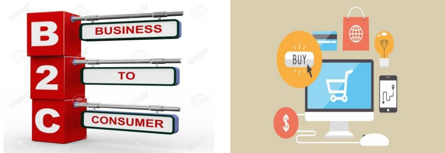
۳: شکل: د کاروباري سازمان او مستهلك يا مشترې تر منځ اړیکه ( https://www.telebazyabi.com )

په دغه ډول تجارت کې خرڅوونکی Business Organization یا تجارتي سازمان وي او اخستونکی مشتری وي. په دغه ډول تجارت کې فزیکي اجناس لکه: کتابونه، بنجاره سامانونه او همدارنگه د معلوماتي اجناسو خرڅول لکه: برېښنايي کتابونه ډیجیټلي شیان شامل دي. ښه مثال یې هغه کمپنۍ دي چې په Online ډول خرید او فروش کوي. Walmart ، Amazon او CD now یې ښه مثالونه دي. (۲۰:۷)