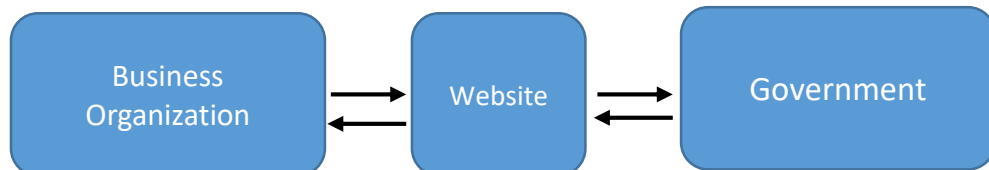
۵: شکل: د تجارتي سازمان او دولت ترمنځ د سوداګريزې راکړې ورکړې اړیکه

دغه ډول تجارت د شرکتونو او دولتي ارګانو تر مینځ سوداګري په بر کې نیسي. یا په بل عبارت دغه ډول برېښنايي سوداګري د کمپنیو او عامه سکتور تر منځ صورت نیسي. یانې دلته د حکومت او کمپنیو تر منځ سوداګري او د معلوماتو تبادله صورت نیسي لکه د کمپنیو څخه د دولت اخیستنې، کمپنۍ دولت ته مالیات تادیه کوي، جواز اخیستل او داسې نور.