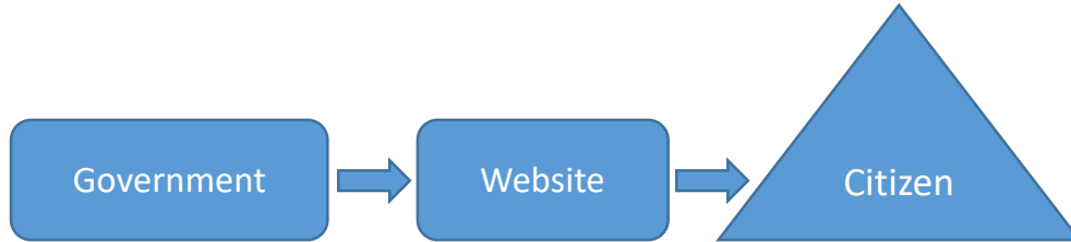
۶: شکل: د دولت او عوامو ترمنځ د اړیکو قايم کيدل

دغه ډول موډل ددې لپاره ده چې عامه خلکو ته دولتي کارونه په لنډ وخت او ښه ډول تر سره شي، نو دلته دولت په همدې موخه د خپلو خلکو لپاره د ځينو سايټونو ملاتړ کوي لکه د پاسپورټ، ليسانس، جواز او داسې نور خدمات په انلاين شکل دولت افرادو ته وړاندې کوي. ( ۵ : ۲۶ )