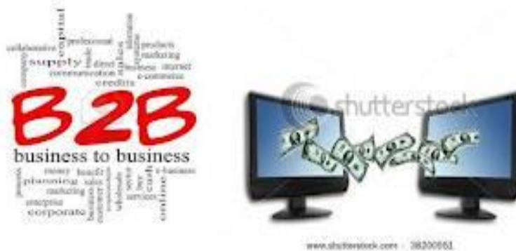
۲: شکل: د B۲B تجارت اړیکه ( https://www.ecommercewiki.org )