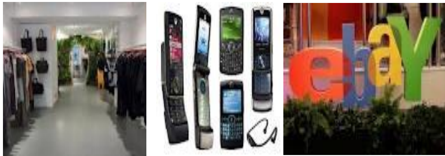
۴: شکل: د مشترې او مشترې ترمنځ د سوداګري اړیکه ( https://www.sendgrid.com )

دا ډول برېښنايي سوداګري د خصوصي اشخاصو تر منځ صورت نیسي، چې د سوداګري په دغه ډول کې اخستوونکی او خرڅوونکی دواړه مشتریان وي. مثلاً: یو مشتری خپل شخصي موټر، موټر سیکل او داسې نور اجناس خرڅلاو ته وړاندې کوي او بل مشتری د همدغو اجناسو د اخستلو امر کوي. eBay سایټ د C۲C تجارت یو ښه مثال ده. (۳۱:۱)